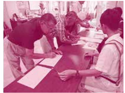
ボランティアの受付訓練

災害ボランティアセンターの訓練は初めての方がほとんどでしたが、受付から送り出し、報告までスムーズな動きが出来ていました。