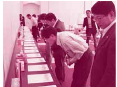
真剣に審査をしています