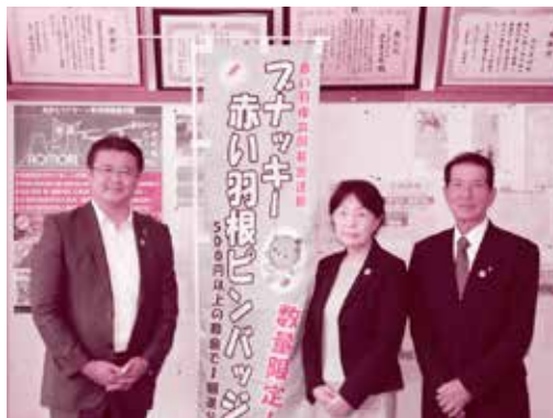
左から、関村長、元木会長、工藤会長