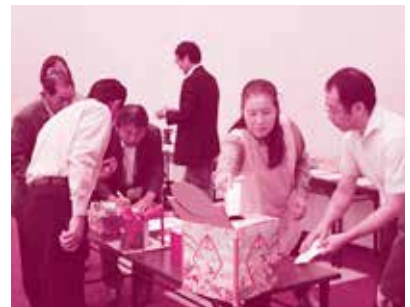
同票の作品もあり再審査中