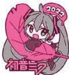
Art by 木下きのこ ©CFM