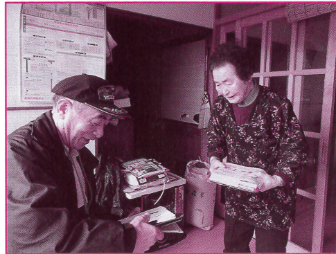
利用者宅へ配達時の様子

お弁当をご自宅までお届けします。 たまに自分で作ったものじゃないのが食べたい方、雪かきで疲れて作りたくないなどの方はぜひご利用ください。