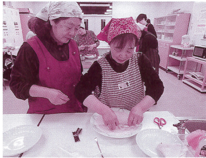
クレープ作りに挑戦中

2月10日(金)に、西目屋村中央公民館で料理教室を行い、7名の参加がありました。