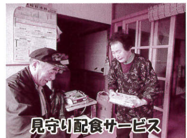
見守り配食サービス