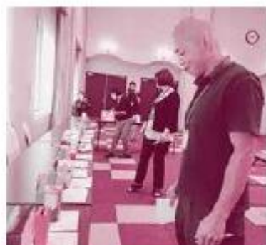
幅広い視点で審査をしています

なお、最優秀賞及び優秀賞2点の作品は、10月1日から始まる「赤い羽根共同募金運動」に合わせて、村内温泉施設にて実際に募金箱として使用されますので、お見かけの際は募金のご協力をお願いいたします。