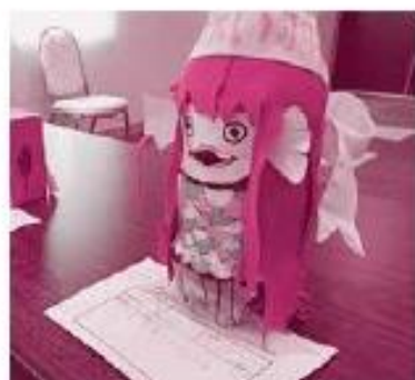
アマビエをモチーフにした作品も